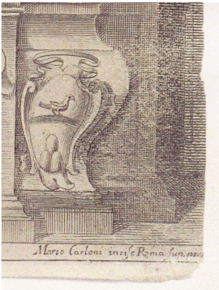
Figura 3 - Stampa Carloni, stemma