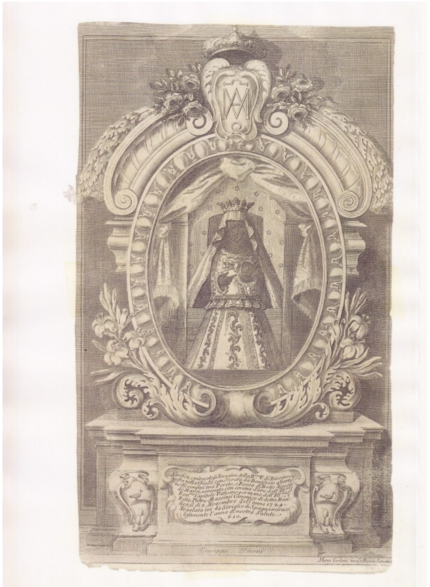
Figura 1 - Stampa Carloni