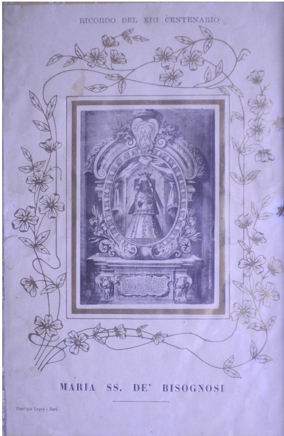
Figura 5 - Stampa Lopez