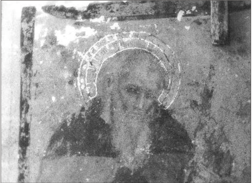
Pereto: chiesa di San Silvestro, affresco secolo XV (particolare).