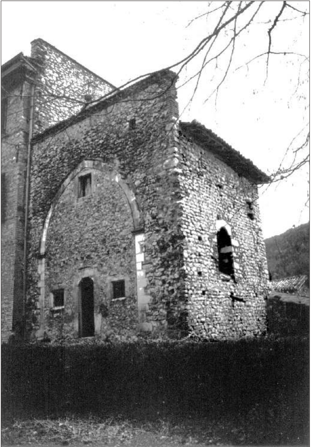
Pereto: chiesa di San Silvestro (1985).