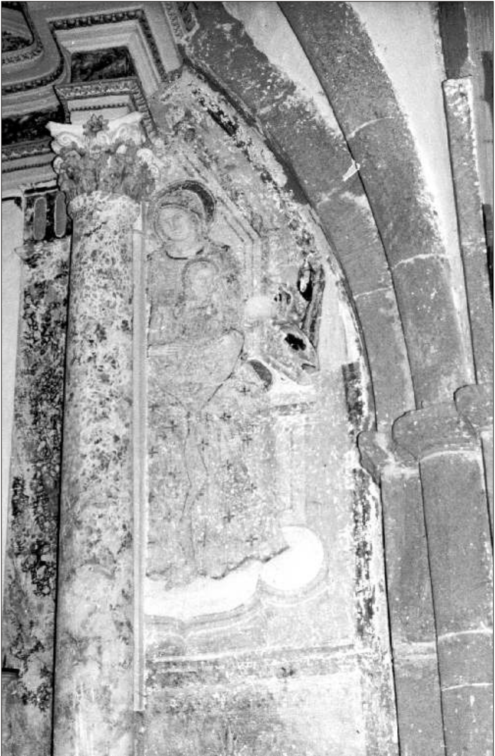
Pereto: chiesa di San Silvestro, affreschi sec. XV.