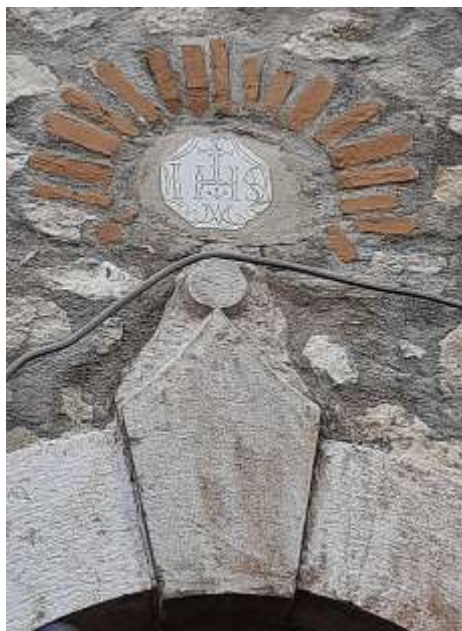
Figura 1 - Architrave casa Giordani

Sull'architrave dell'abitazione è presente una pietra a forma di tiara, simbolo del papa e sopra, in una mattonella di marmo, il monogramma IHS (Figura 1). Intorno sono disposti a raggiera dei mattoni rossi. La mattonella ed i mattoni rappresentano un'ostia con dei raggi, simbolo a carattere religioso.