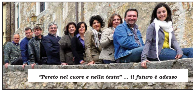
"Pereto nel cuore e nella testa" ... il futuro è adesso

(voucher formativi, fondi privati o pubblici) si garantirà la possibilità di studio e professionalizzazione dei giovani fuori dal territorio di appartenenza, stabilendo come contropartita l'impiego poi di tale risorse in ambito locale una volta formate.