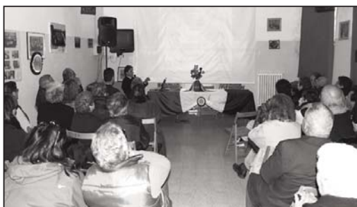
Nelle immagini due momenti dei festeggiamenti

A sinistra: un momento dell'incontro avvenuto nei locali dell'Università della Terza Età a Pereto