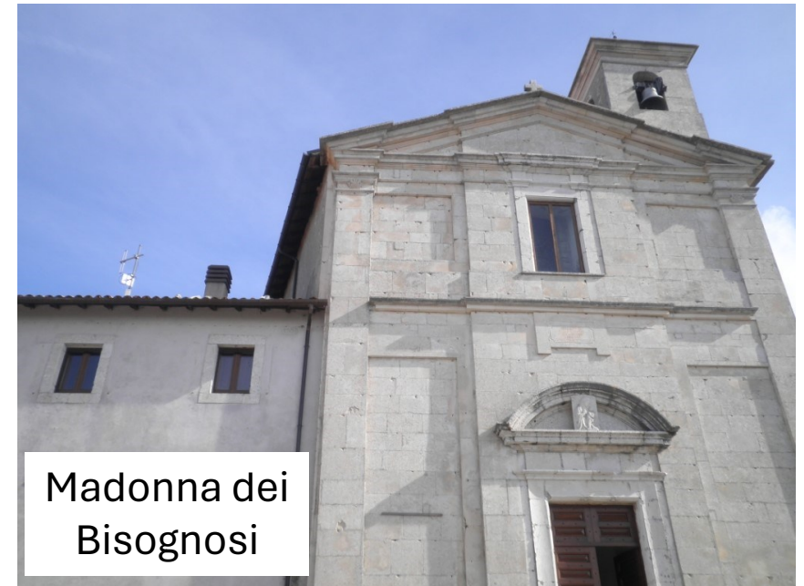
Madonna dei Bisognosi