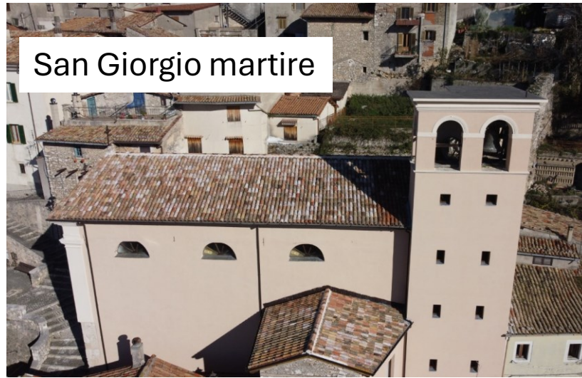
San Giorgio martire