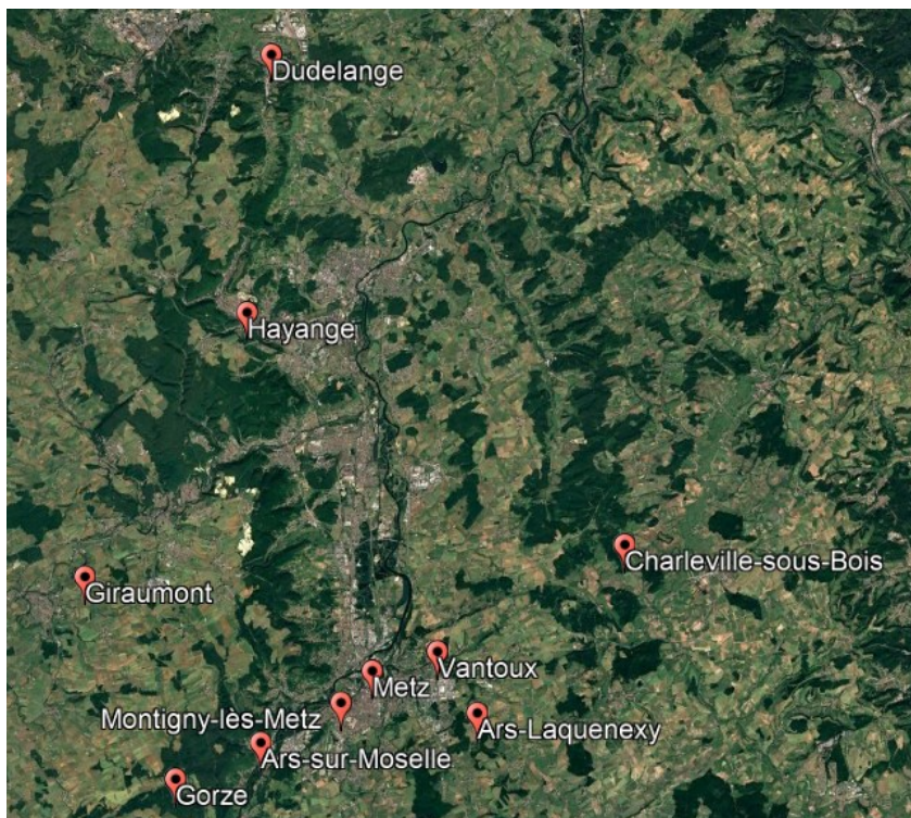
Figura 1 – Mappa Europa

Di seguito è mostrata una mappa con i comuni della Francia e del Lussemburgo citati nella ricerca. 4